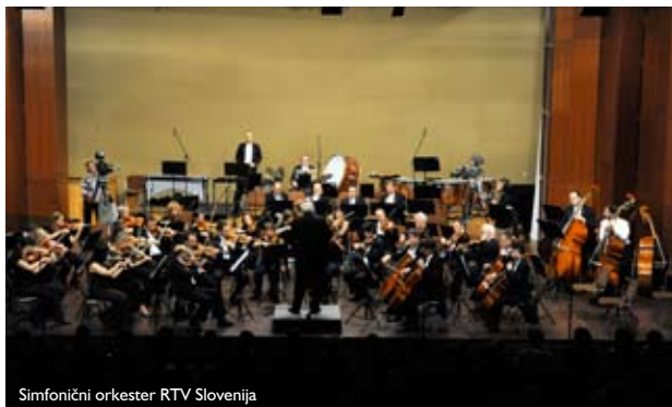
Simfonični orkester RTV Slovenija