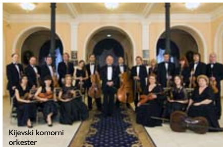
Kijevski komorni orkester